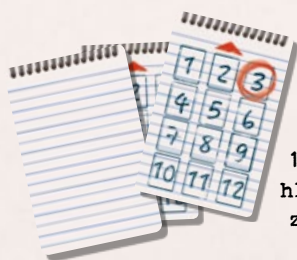
12 karet hledaného zločince