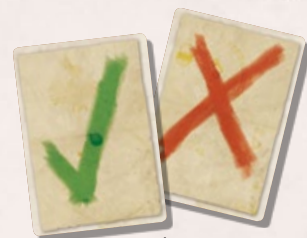
1 karta ANO 1 karta NE