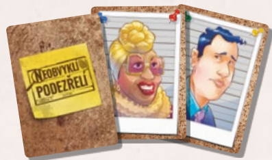
70 karet podezřelých