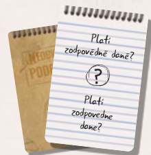
110 karet s otázkami